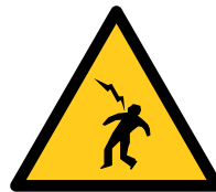
Alta Tensión Muerte