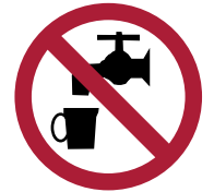
Agua no Potable