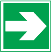
Dirección que debe Seguirse