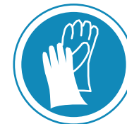
Protección Obligatoria de las Manos