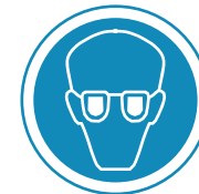
Protección Obligatoria de la Vista