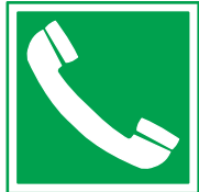
Teléfonos de Salvamento