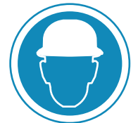
Protección Obligatoria de la Cabeza