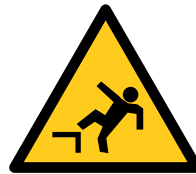
Caída a Distinto nivel