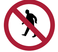
Prohibido Transitar Peatones